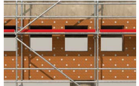
Druckfeste Dämmstoffe in vorgehängter Fassade