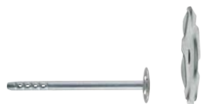
DHM, Teller- \varnothing 35 mm