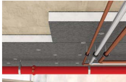
Druckfeste Dämmstoffe an Deckenunterseite